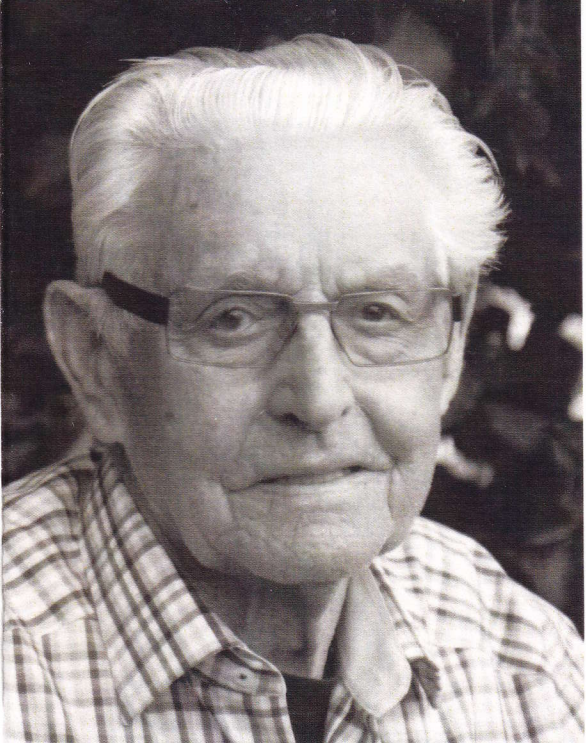
Fien Bos Uitvaartzorg

De zeswakedienst zal plaatsvinden op zondag 11 augustus om 11:00 uur in de parochiekerk van Grashoek.